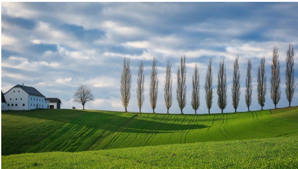
trees_8458466_1280_watercolor.jpg 木、秋、秋の色画像