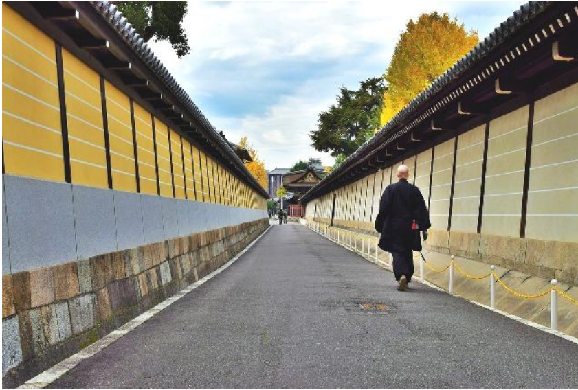
「京都、日本、ストリートビュー：pixabay」 photo by LiveLyfePhotography