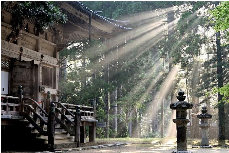
「太陽光線、森林、高野山」