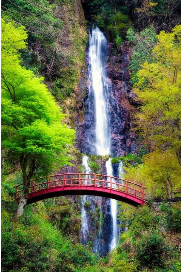
岐阜県/五宝滝「滝 橋 木 pixabay」