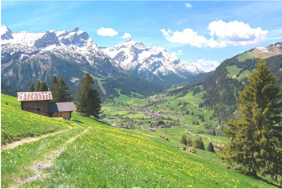
スイス ベルナーオーバーラント