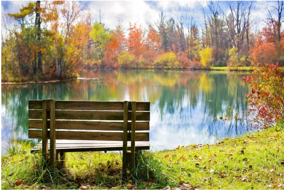
「木製のベンチ・木・池・秋：pixabay」 Photo by ApplesPC