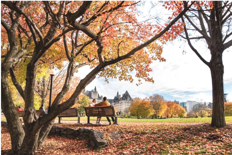
「秋 公園 ベンチ カップル 木 屋外」オタワ カナダ