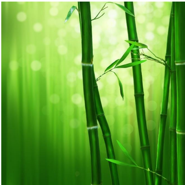
「京都、日本、ストリートビュー：pixabay」 photo by livelyfephotography